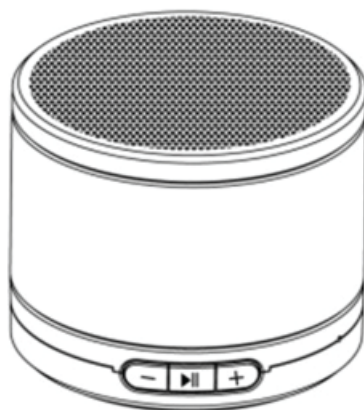
Příručka uživatele DA-10285